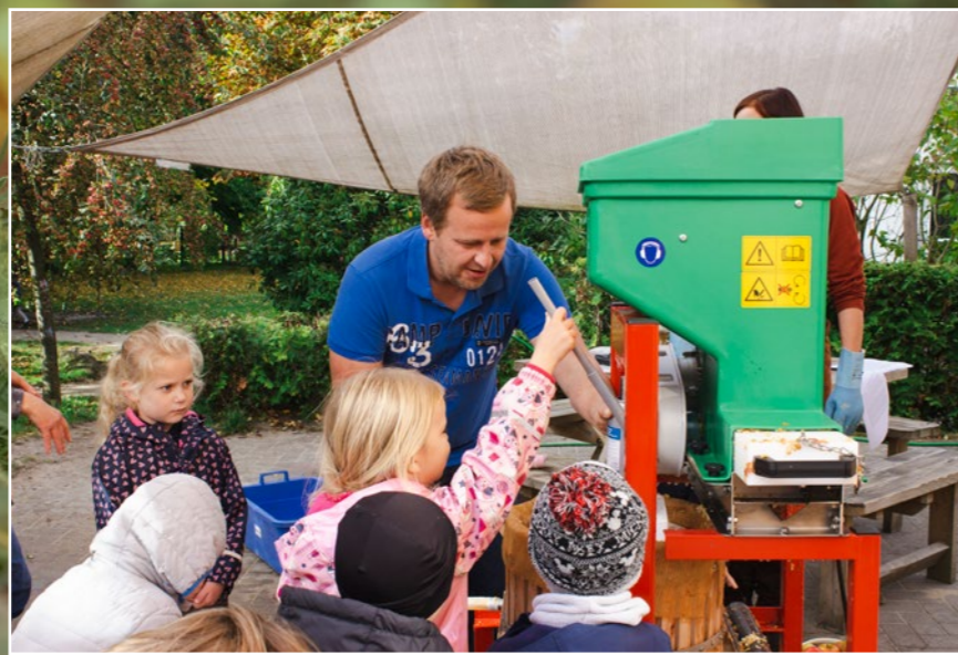
Äpfel ernten und zu leckerem Saft verarbeiten – viel Spaß für Kinder, Eltern und Mitarbeitende der Kita Pfiffikus.