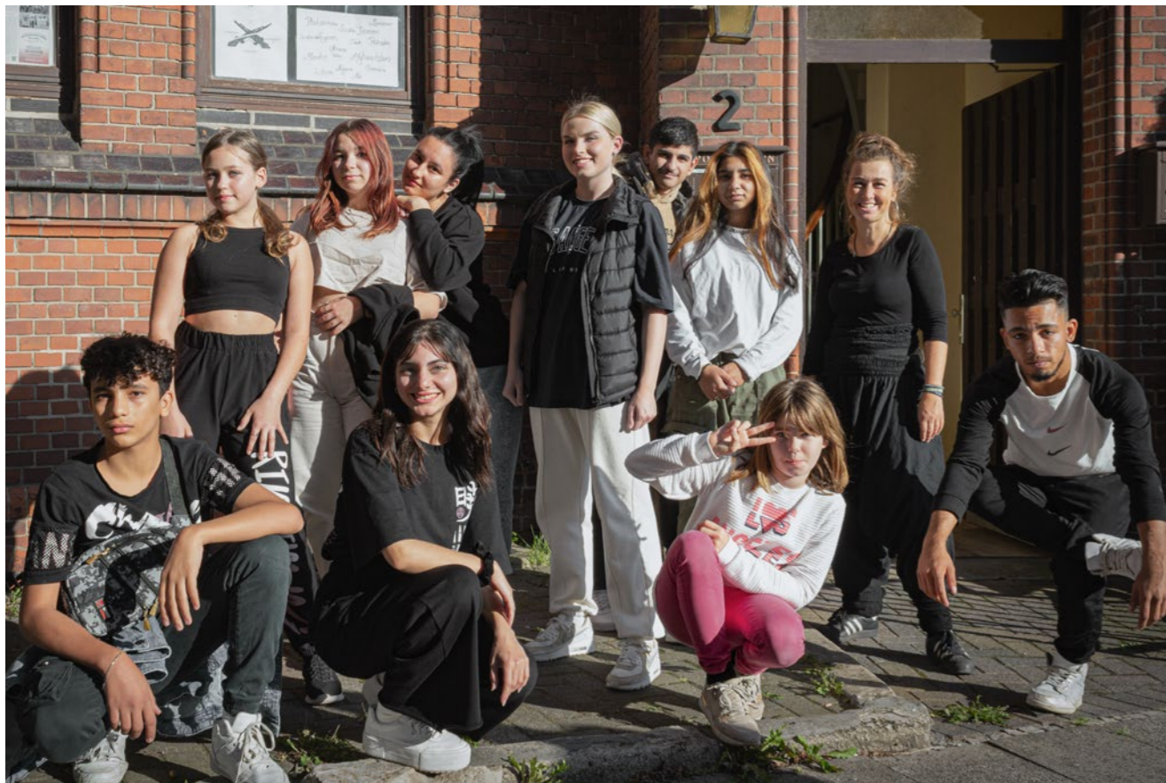
Gruppenbild mit Weltmeisterin: die tanzbegeisterten Jugendlichen mit Leonie Ozeana (Bildmitte).