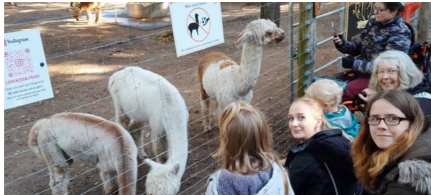
Einen tollen Tag verlebten Eltern, Kinder und Mitarbeiterinnen der Vater/Mutter-Kind-Einrichtung Hamme Lou im Wolfcenter, in dem auch Alpakas leben.

Die Adventskalenderaktion des Lions Clubs 2021 Bremerhaven Carlsburg war für uns besonders schön, da wir eine Spende von 900 € für das Mutter/Vater-Kind-Haus bekommen haben. Von dem Geld haben wir unseren Müttern und Kindern mit einem Ausflug zum Wolfcenter ein ganz besonderes Erlebnis ermöglicht. Aus pädagogischen Gründen haben wir öffentliche Verkehrsmittel genutzt und dadurch viele Lerneffekte für unsere Mütter geschaffen. Es ging also mit dem Zug nach Eystrup zu unserem Hotel. Für den Transport des Gepäcks begleitete uns eine Mitarbeiterin mit dem Auto. So konnten sich die Mütter voll auf ihre Kinder einstellen. Im Hotel hatte jede Mutter ein Einzelzimmer mit ihrem Kind. Dort genossen wir erst einmal das mitgebrachte Picknick. Den Nachmittag hatten wir der Erkundung der Natur gewidmet. Das Hotel lag an einem wunderschönen Wald. Bei einer Waldrallye lernten die Mütter und Kinder unsere heimische Umwelt ken-